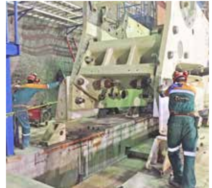
Grouting de los equipos de trituración y sus motores con resina epoxi Chockfast Rojo y Chockfast Naranja . Unidad "Tayahua", Zacatecas, México.