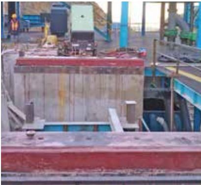
Instalación de base de molino con la resina epoxi Chockfast Rojo . Unidad minera "San Francisco del Oro", México.