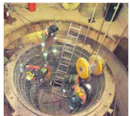
Regrouteo con resina epoxi Chockfast Rojo de la trituradora giratoria METSO por hundimiento de los puntos de apoyo. Unidad "Milpillás", Minera La Parreña, México.