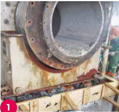
1 Rehabilitación de la chumacera de descarga en un molino de barras. Minera "Roca Rodando", Hermosillo, México.