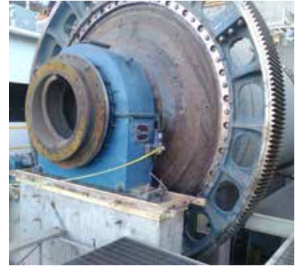
Rehabilitación de bases de molino con resina epoxi Chockfast Rojo . Unidad "La Encantada", Grupo First Majestic, Coahuila, México.