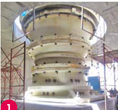
1 Instalación de una trituradora giratoria marca METSO. Mina de Cobre, Grupo México, Cananea, México.