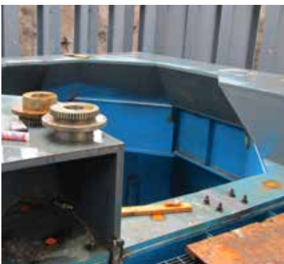
Instalación y montaje de una quebradora giratoria primaria con Chockfast Naranja . Unidad "El Coronel", Minera Real de Ángeles, México.