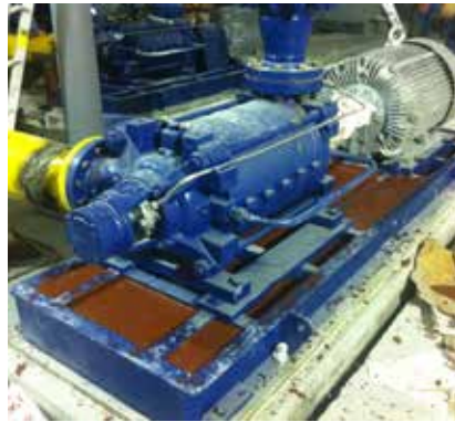
Relleno del skid de dos bombas con la resina epoxi Chockfast Rojo para eliminar las vibraciones que presentaban. La mina "El Roble", México.