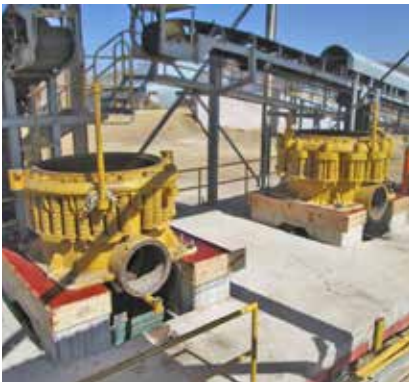
Preparación de nuevos barrenos para los pernos de anclaje y re-grouteo con resina epoxi Chockfast Rojo de las trituradoras por cambio de ubicación. Unidad minera "La Plata", México.