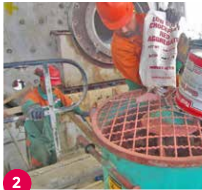
2 La unidad mostraba desprendimiento del grout cementoso, alto grado de oxidación de la placa y agrietado de la columna base.