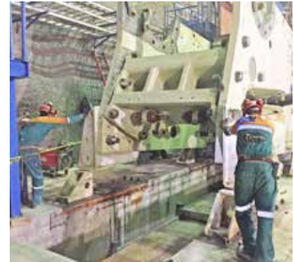
Grouting de los equipos de trituración y sus motores con resina epoxi Chockfast Rojo y Chockfast Naranja . Unidad "Tayahua", Zacatecas, México.