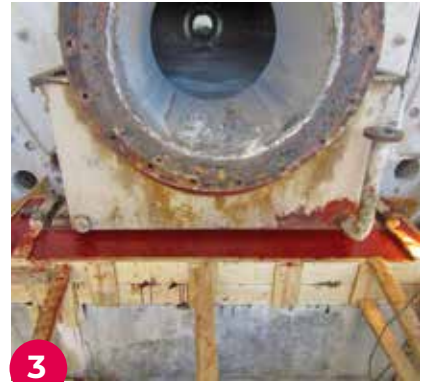
3 La base se rehabilitó con la resina epoxi Chockfast Rojo . En la imagen, detalle del encofrado durante la aplicación.