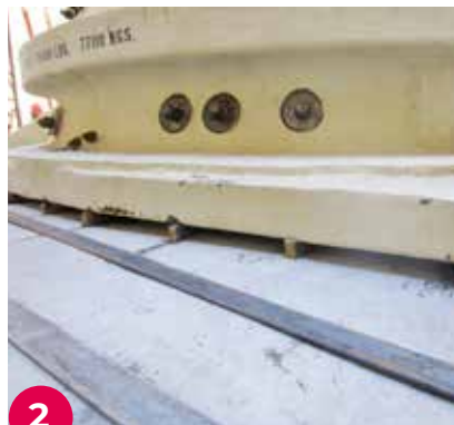
2 La nueva unidad se instaló sobre tacos de resina epoxi Chockfast Naranja . En la imagen, detalle del encofrado para realizar los tacos de resina.