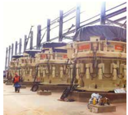
Fijación de 14 trituradoras con la resina epoxi Chockfast Rojo . Proyecto de ampliación de la mina "Buenavista del Cobre", Cananea, México.