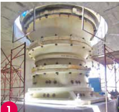
1 Instalación de una trituradora giratoria marca METSO. Mina de Cobre, Grupo México, Cananea, México.