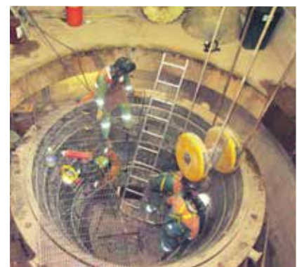
Regrouteo con resina epoxi Chockfast Rojo de la trituradora giratoria METSO por hundimiento de los puntos de apoyo. Unidad "Milpillás", Minera La Parreña, México.