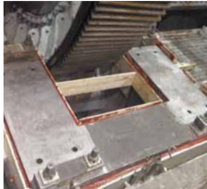
Rehabilitación de las cimentaciones de apoyo de los piñones de 6 molinos con la resina epoxi Chockfast Rojo . Mina "Buenavista del Cobre", Cananea, México.