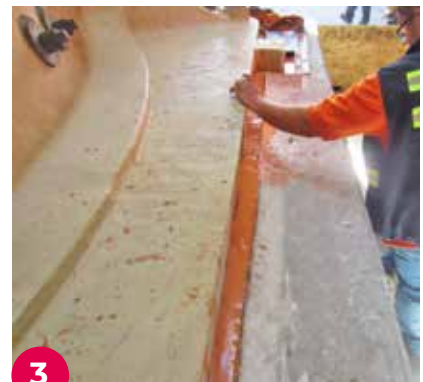
3 En la imagen, detalle del vertido de la resina en el taqueado.