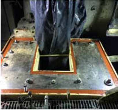
Reparación de base para piñón de bolas con resina epoxi Chockfast Rojo . Unidad "La Colorada", México.