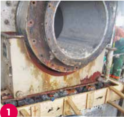
1 Rehabilitación de la chumacera de descarga en un molino de barras. Minera "Roca Rodando", Hermosillo, México.