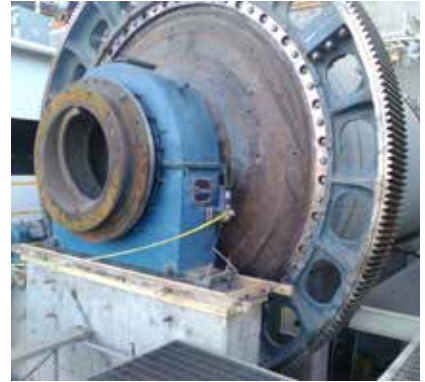
Rehabilitación de bases de molino con resina epoxi Chockfast Rojo . Unidad "La Encantada", Grupo First Majestic, Coahuila, México.