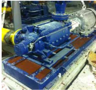
Relleno del skid de dos bombas con la resina epoxi Chockfast Rojo para eliminar las vibraciones que presentaban. La mina "El Roble", México.