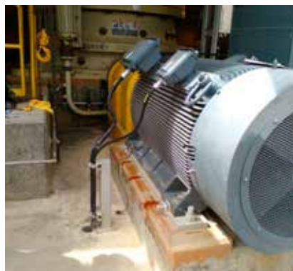
Taqueado de los equipos de trituración y motores eléctricos con la resina epoxi Chockfast Naranja . Mina de metales preciosos "Media Luna", México.