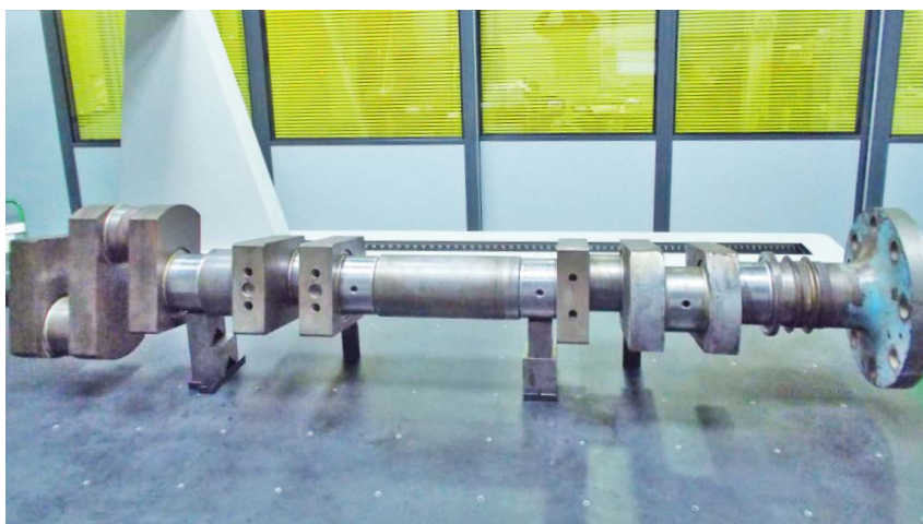
Controlo da cambota no centro de verificação.