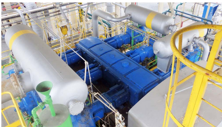
Trabalho de manutenção em compressor alternativo.

Também dispõe de fabrico local de peças de emergência Baker Hughes conforme especificações originais com suporte da engenharia da Baker Hughes e de novos materiais para aumentar a eficiência e os intervalos MTBM e MTBR.