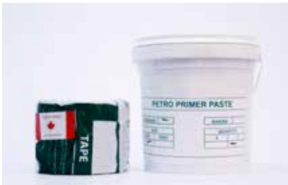
Formato de Cinta engrasada y Primer .

La cinta anticorrosión PETRO TAPE está disponible en formato de 50, 100, 150 y 200mm de anchura.