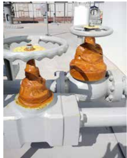
Protección de conexiones hidráulicas.