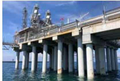
Pilotes metálicos oxidados en plataforma offshore.