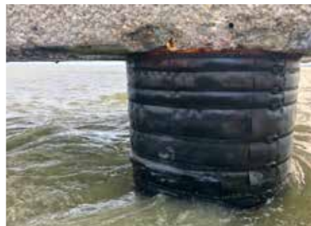
Pilote con protección anticorrosión Tidal Wrap.