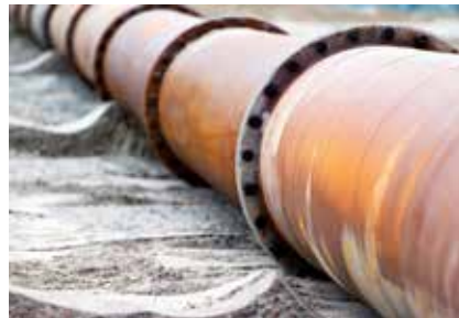
Conducciones corroídas bajo tierra.