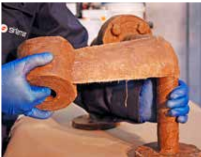
Cinta Anticorrosión o PETRO TAPE con base de Petrolato.

Las Cintas Anticorrosión o PETRO TAPE con Petrolato se caracteriza por su fácil instalación, larga duración y por ser respetuoso con el medio ambiente.