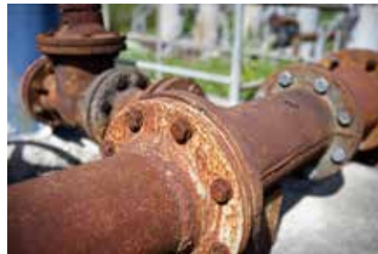
Válvulas y conductos expuestos a corrosión.