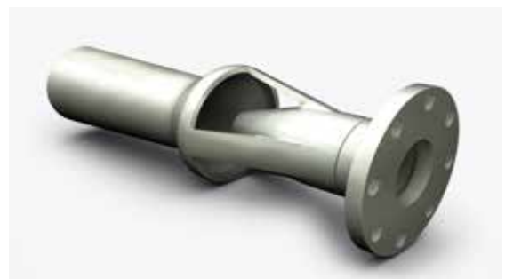
Eductores 3E para homogeneización y blending en tanques de hidrocarburos.