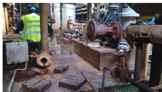
Eliminación del recubrimiento y las losetas. Saneado del hormigón.