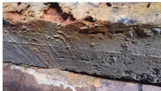
Hormigón de solera contaminado como consecuencia de continuos derrames de ácido clorhídrico. Recubrimiento existente dañado por el ataque químico y las losetas despegadas con rotura en juntas.