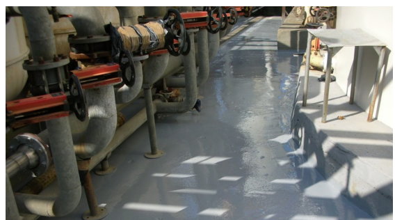
Reconstrucción y protección de superficies de hormigón con DEVCON Epoxy Coat 7000AR.