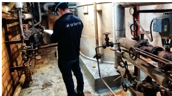
Estudio de la problemática en la solera de los depósitos de almacenamiento de ácido clorhídrico 33% de una planta siderúrgica.