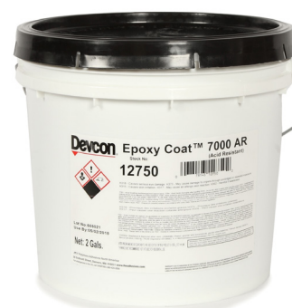
DEVCON Epoxy Coat 7000AR Ref.12750 Formato de 8,54 kg (7,56l).