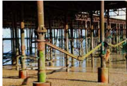
Pilotes metálicos oxidados en un muelle.