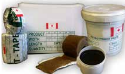
Componentes del Sistema Anticorrosión.

La cinta anticorrosión PETRO TAPE está disponible en formato de 50, 100,150 y 200mm de anchura.