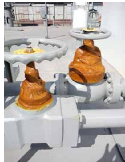
Protección de conexiones hidráulicas.