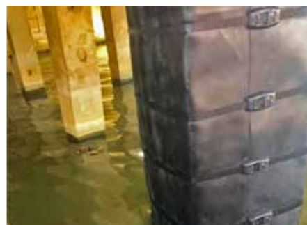
Pilote con protección anticorrosión Tidal Wrap.