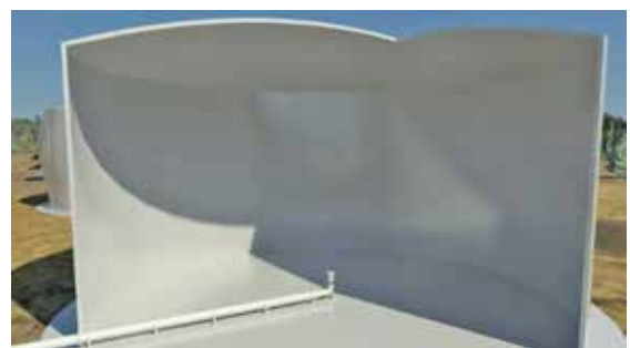
Agitador P43 para el mezclado y homogeneización de fluidos en tanques de almacenamiento.